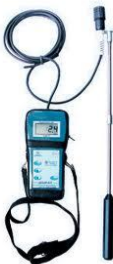
Рис. 2. Газосигналізатор Дозор С-П

Для встановлення наявності витоків метану в зразку використовується газосигналізатор Дозор С-П, зображення якого наведено на Рис. 2