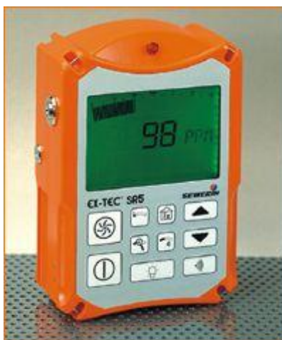
Рис. 3.Газосигналізатор Варіотек – 6

Технічні характеристики газосигналізатора Варіотек – 6 наведені в Таблиці 4.