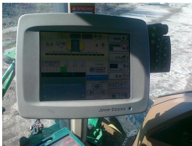
Рис. 5. Дисплей «GreenStar2»