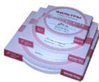
Рис. 3. Фільтри обеззолені

Інше обладнання та необхідні реактиви знаходяться на балансі лабораторії Національної академії аграрних наук України Національного наукового центру «Інститут землеробства НААН».