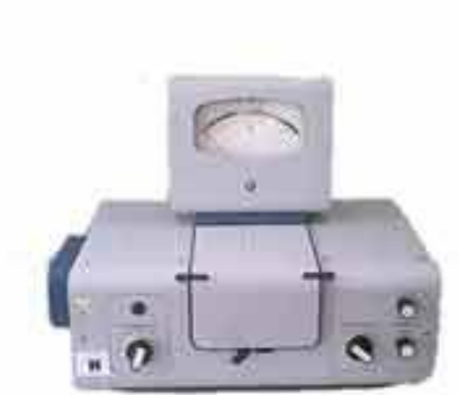
Рис. 1. Фотоелектроколориметр