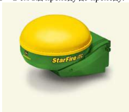
Рис. 4. Приймач «StarFire iTC»