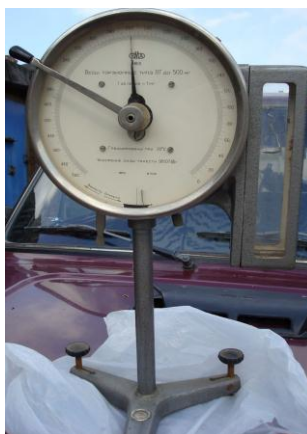
Рис. 2. Ваги торсіонні