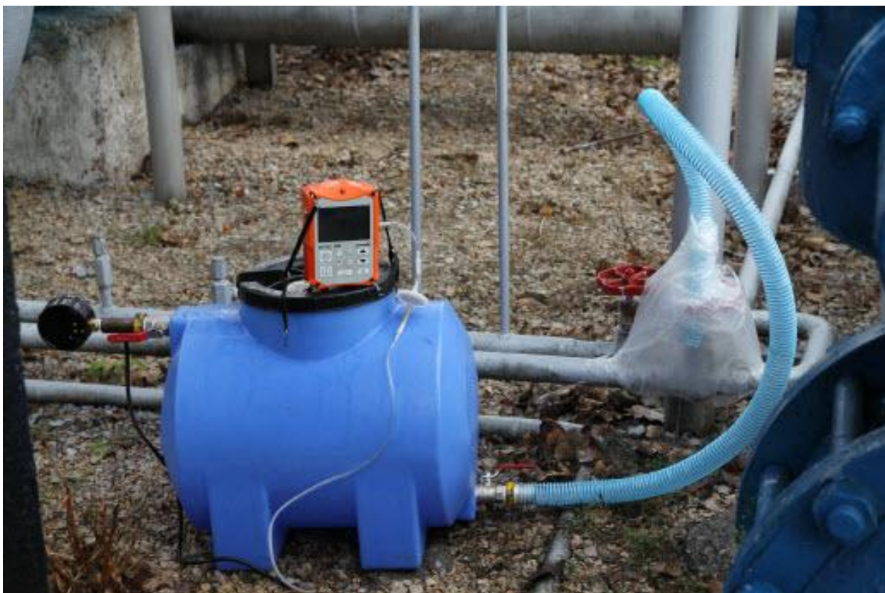
Рис. 1. Фото установки кількісного вимірювання витоків метану

Для вирішення цих проблем було виготовлено спеціальну установку на базі пластикової ємності відомого об'єму (0,11 м 3 ), пакету, пластикового шлангу і манометра (Рис. 1). Всі з'єднання виконані герметично.