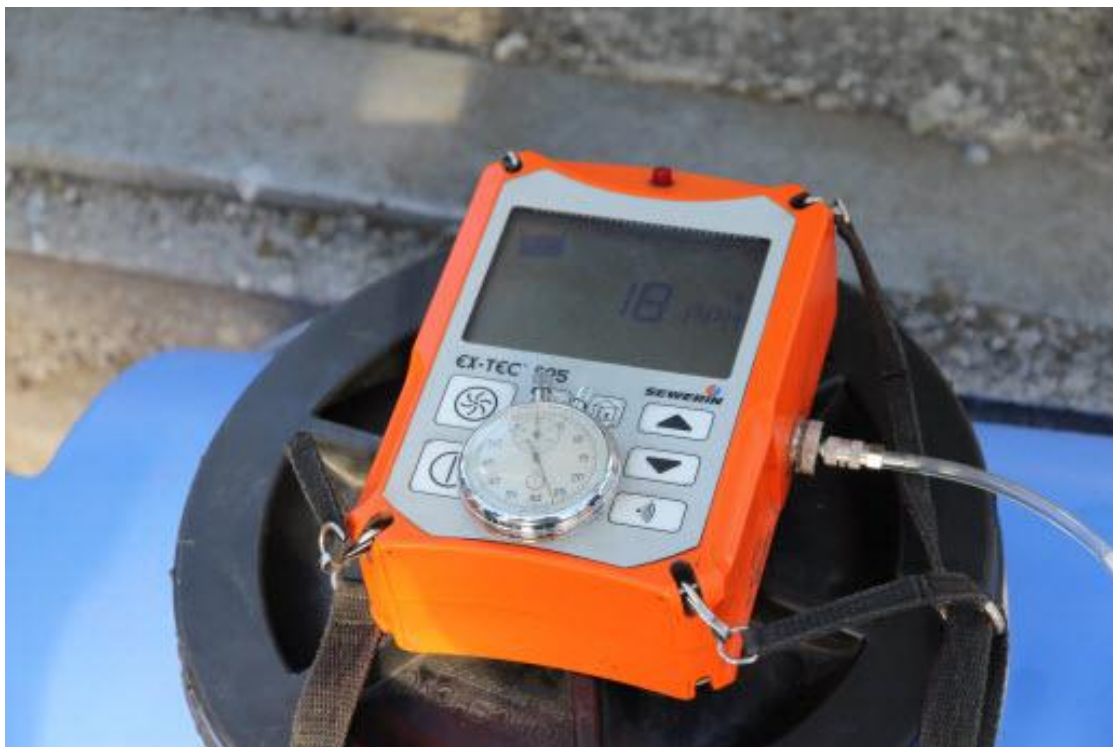
Рис. 2. Фото газоаналізатору EX-TEC® SR5 та секундоміру СОС пр-2б-2

Газоаналізатор має захист від вибуху (CENELEC).