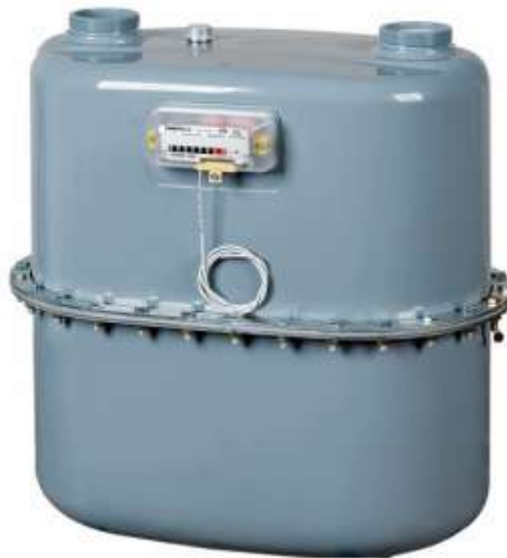
Рис. 2. Промисловий лічильник газу G-25 виробництва «Самгаз»

Повний перелік вимірювального обладнання в зв'язку зі значною кількістю абонентів зберігається на підприємстві.