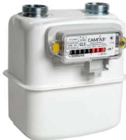
Рис. 1. Побутовий лічильник газу G-2,5 виробництва «Самгаз»

Типовий побутовий лічильник обліку кількості природного газу показано на Рис. 1.