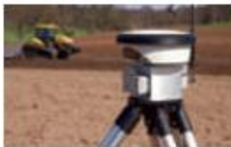
Рис. 6. Мобільна база RTK