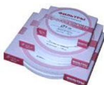
Рис. 3. Фільтри обеззолені

Інше обладнання та необхідні реактиви знаходяться на балансі національного наукового центра «Інститут землеробства НААН».