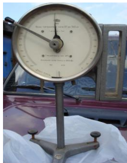
Рис. 2. Ваги торсіонні Виробник – Польща. Похибка вимірювань не перевищує 1 мг.