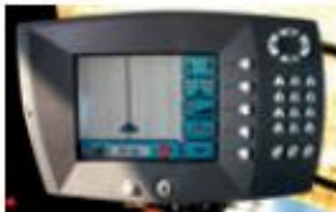
Рис. 5. Дисплей системи «Auto-Guide Challenger»