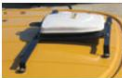
Рис. 4. GPS приймач