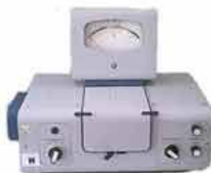
Рис. 1. Колориметр фотоелектронний концентраційний

Колориметр фотоелектронний концентраційний типу КФК-2, границя допустимого значення основної абсолютної похибки фотоколориметра при вимірюванні коефіцієнтів пропускання \Delta = \pm 1\% . Спектральний діапазон від 315 нм до 980 нм.