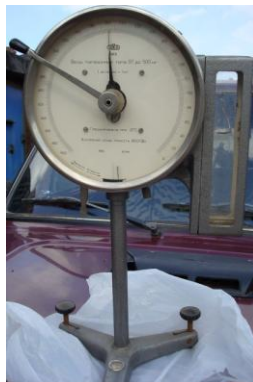
Рис. 2. Ваги торсійні Виробник – Польща. Похибка вимірювань не перевищує 1 мг.