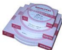
Рис. 3. Фільтри обезоленні

Інше обладнання та необхідні реактиви знаходяться на балансі лабораторії інженерно технологічного інституту «Біотехніка».