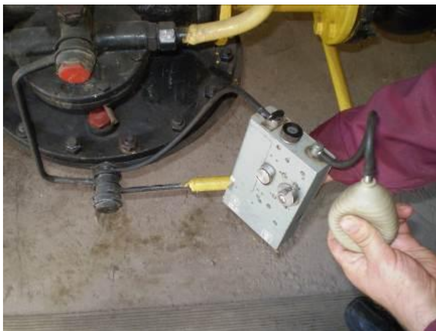
Рис. 2. Фото вимірювальних робіт, м. Харків

Для вирішення цих проблем було придбано індивідуальні Шахтні інтерферометри ШИ-10 (ШИ-11), технічні характеристики якого наведено нижче в Табл. 3: