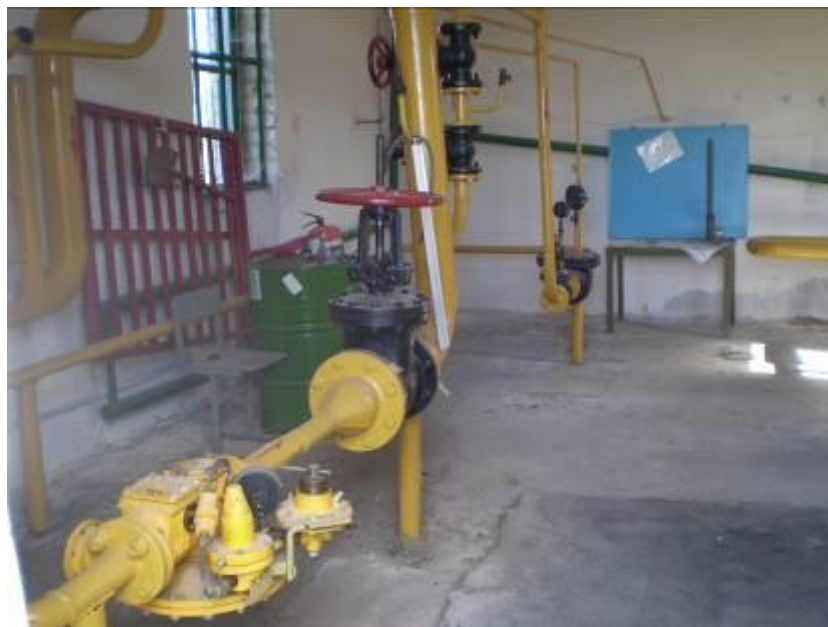
Рис. 1. Відремонтоване ГРП, м. Харків