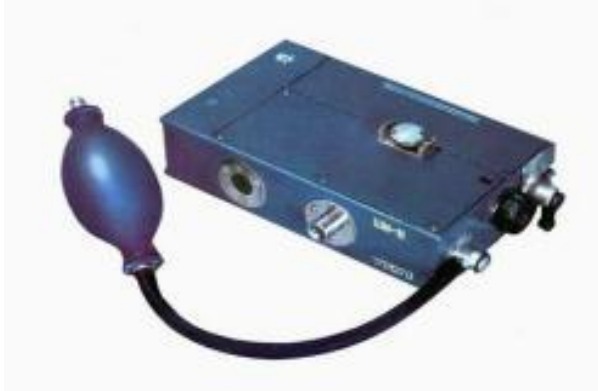
Рис. 3. Шахтний інтерферометр ШИ-10 (ШИ-11)

Шахтний інтерферометр ШИ-10 (ШИ-11). Для встановлення наявності витоку метану в зразку використовується сигналізатор-експлозіметр термохімічний ШИ-10 (ШИ-11), зображення якого наведено на Рис. 3