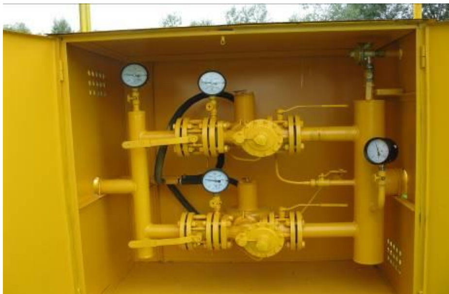
Рис. 1. Відремонтоване ШРП, м. Чернігів