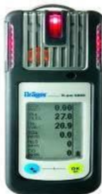
Рис. 3. Газоаналізатор Dräger X-am® 5600

Dräger X-am® 5600. Для встановлення наявності витоку метану в зразку використовується газоаналізатор Dräger X-am® 5600, зображення якого наведено на Рис. 3