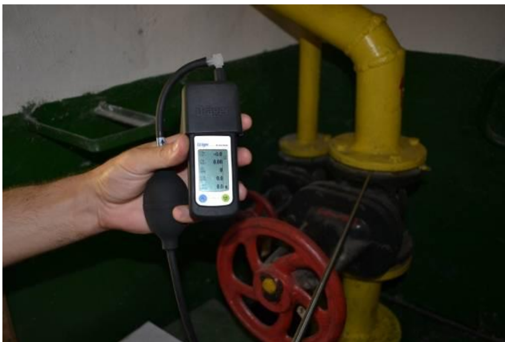
Рис. 2. Фото вимірювальних робіт, м. Чернігів

Для вирішення цих проблем було придбано індивідуальні газоаналізатори (газосигналізатори) газоаналізатор Dräger X-am® 5600, технічні характеристики якого наведено нижче (Таблиця 3):