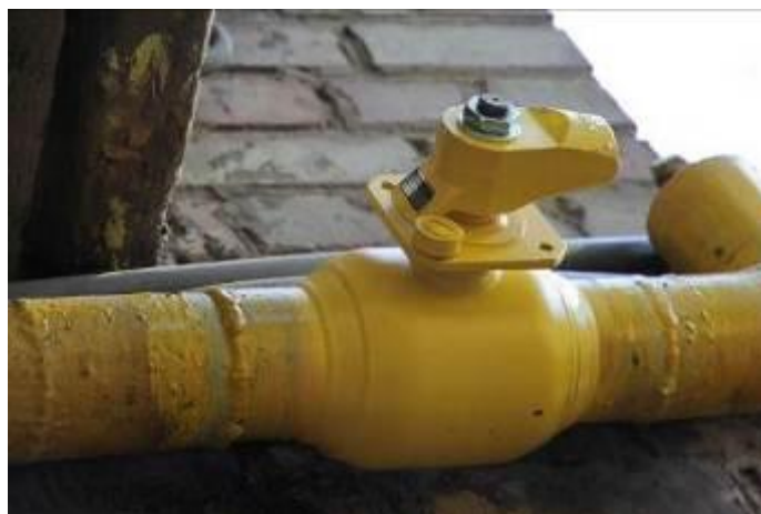
Рис. 2. Шаровий кран DN80, реєстровий номер 3944 (пр. 40-річчя Жовтня 46-А).