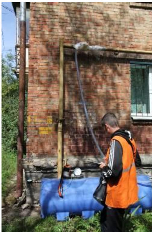
Рис. 5. Моніторинговий вимір на шаровому крані, реєстровий номер 2525 (вул. Щербакова, 62-А).