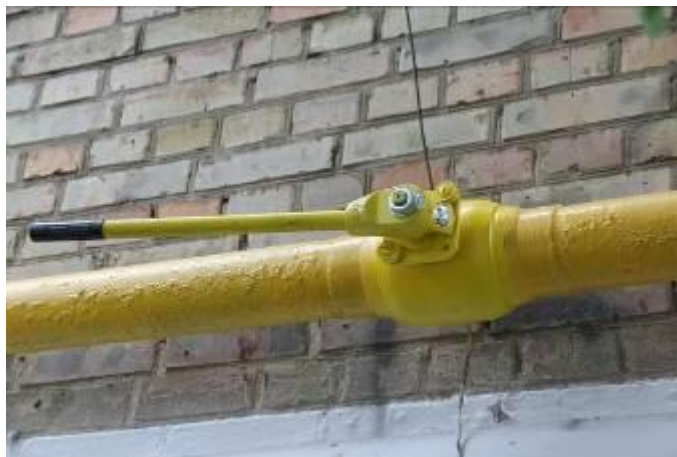
Рис. 1. Шаровий кран DN100, реєстровий номер 8051 (вул. Кіквідзе, 4)

Фотографії вимикаючих пристроїв європейського виробництва, на які в рамках проекту було замінено морально застаріле газове устаткування радянського та пострадянського періоду наведено на Рис. 1-3.