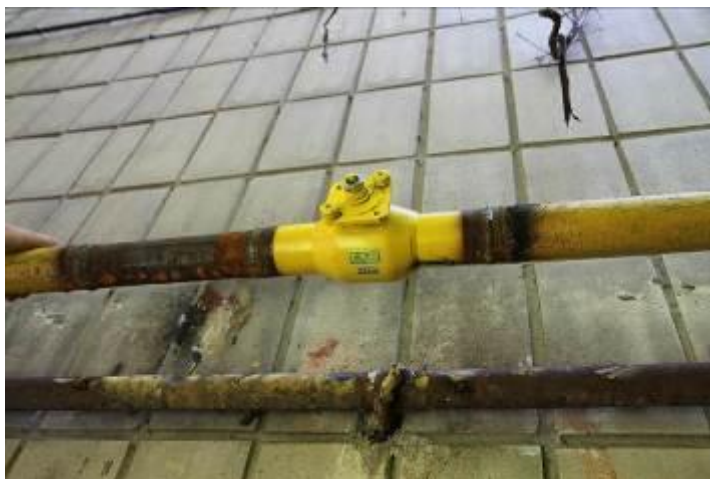
Рис. 3. Шаровий кран DN50, реєстровий номер 3927 (пр. 40-річчя Жовтня 108/2)

Фотографії моніторингових вимірів за звітний період наведені на Рис. 4-5: