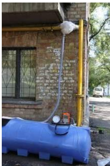
Рис. 4. Моніторинговий вимір на шаровому крані, реєстровий номер 3944 (пр. 40-річчя Жовтня 46-А).

Фотографії моніторингових вимірів за звітний період наведені на Рис. 4-5: