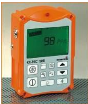
Рис. 7. Фото газоаналізатору EX-TEC® SR5

Газоаналізатор EX-TEC® SR5. Для визначення концентрації метану в зразку використовується високоточний газоаналізатор EX-TEC® SR5.