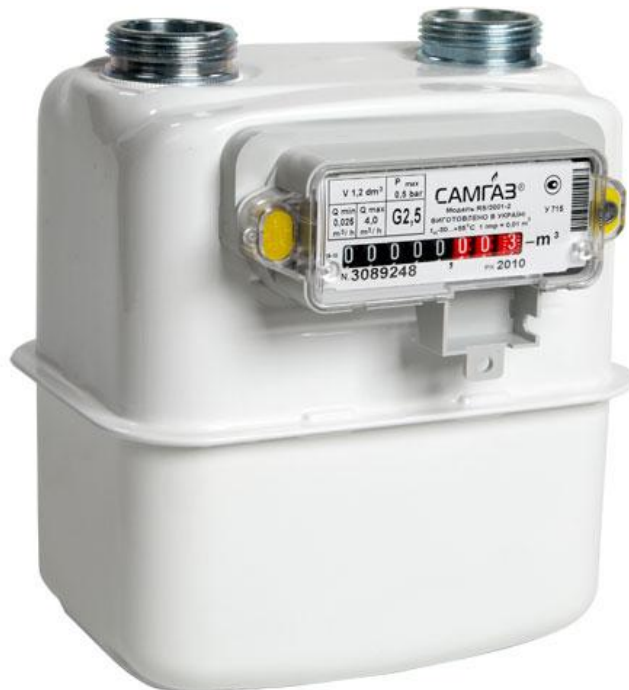
Рис. 2. Побутовий лічильник газу G-2,5 виробництва «Самгаз»