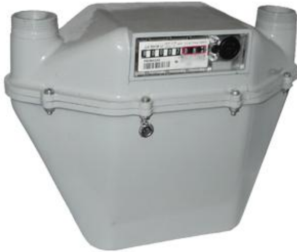
Рис. 1. Лічильник газу МКМ-U G-4 виробництва Pretagas