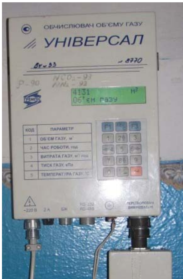
Рис. 1. Встановлення на котельні лічильника газу з коректором