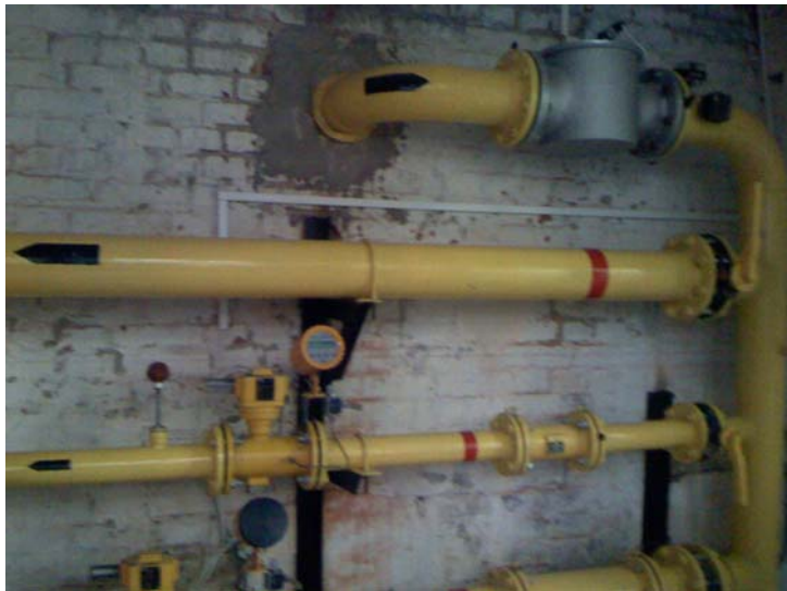
Рис. 2. Газо-розподільний пункт.

Контроль та моніторинг системи зводиться до вимірювання споживання палива. Інші параметри отримуються розрахунковим шляхом або з статистичних даних. Вимірювання споживання палива відбувається на газо-розподільному пункті котельні. Реєстрація газу відбувається в одиницях об'єму приведених до стандартних умов за допомогою автоматичних коректорів по температурі і тиску. Типовий газо-розподільний пункт наведено на Рис. 2, типовий газовий лічильник наведено на Рис.3.