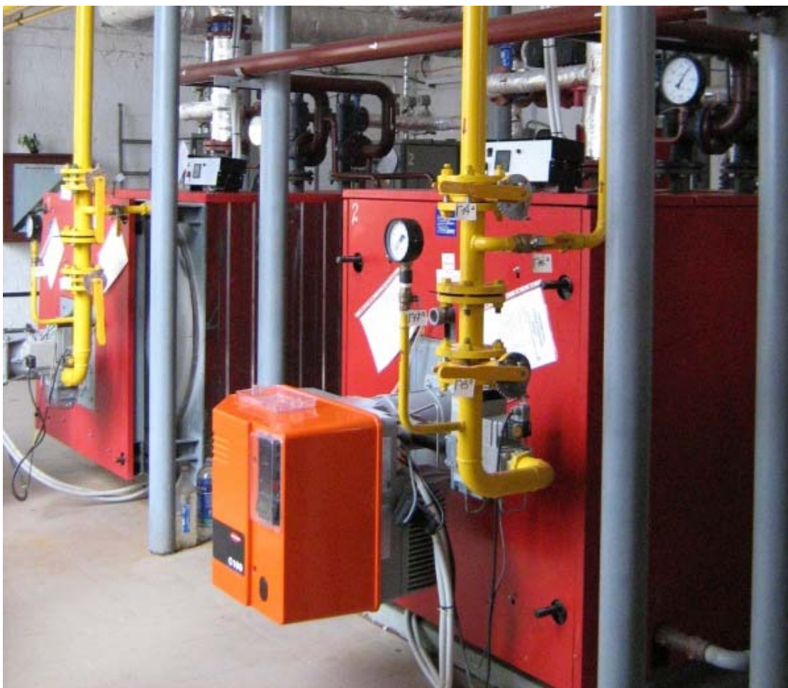
Рис. 1. Реконструкція котельні Міська лікарня №6 (№519 у проекті) із встановленням котлів Колві