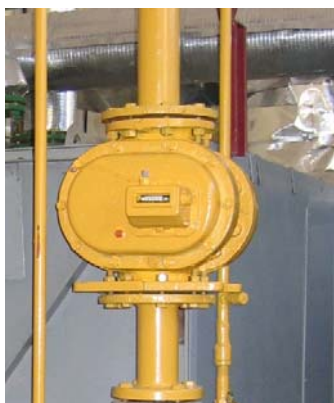
Рис. 3. Газовий лічильник.

Типова схема газо-розподільного пункту показана на Рис. 4. Звичайно він складається з наступного обладнання: