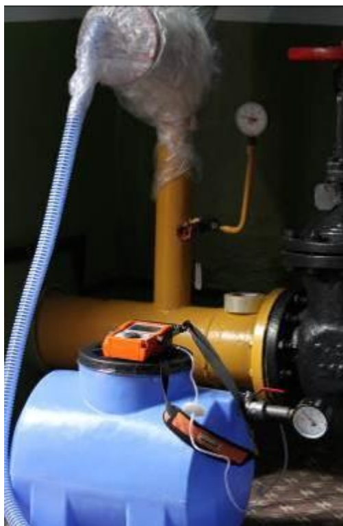
Рис. 1. Фото установки для кількісного вимірювання витоків метану.

Для вирішення цих проблем було виготовлено спеціальну установку на базі пластикової ємності відомого об'єму ( 0,11 \text{ м}^3 ), пакету, пластикового шлангу і манометра (див. Рис. 1). Всі з'єднання виконані герметично.