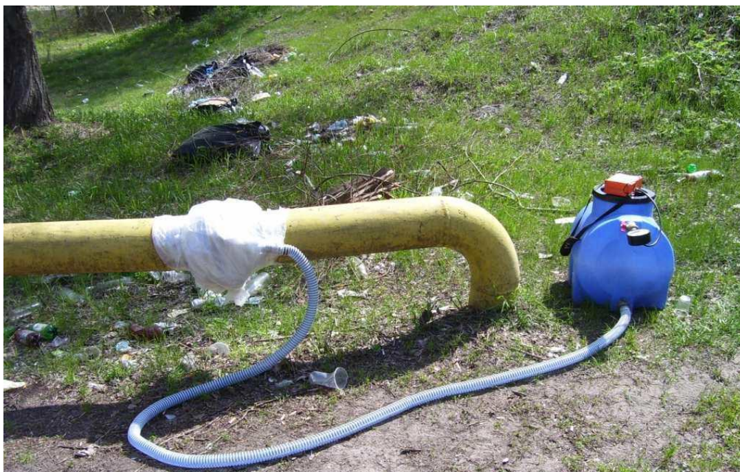
Мал.. 1. Фото установки для кількісного вимірювання витоків метану

Для вирішення цих проблем було виготовлено спеціальну установку на базі пластикової ємності відомого об'єму ( 0,87 \text{ м}^3 ), пакету, пластикового шлангу і манометра (див. Мал. 1). Всі з'єднання виконані герметично.