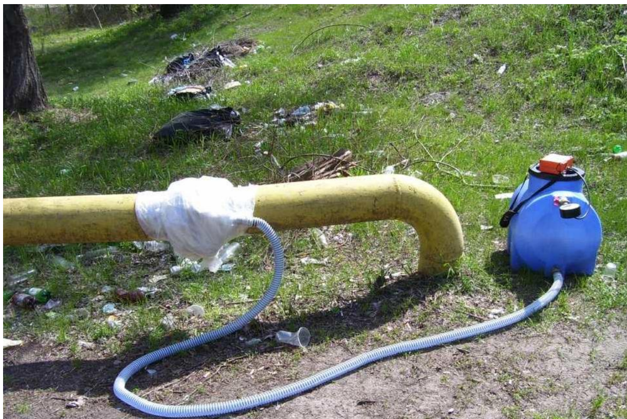
Мал. 1. Фото установки для кількісного вимірювання витоків метану.

Для вирішення цих проблем було виготовлено спеціальну установку на базі пластикової ємкості відомого об'єму (0,87 м 3 ), пакету, пластикового шлангу і манометра (див. Мал. 1). Всі з'єднання виконані герметично.