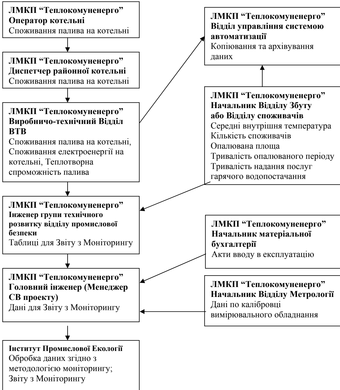
Рис..6. Схема збору даних для Звіту з Моніторингу