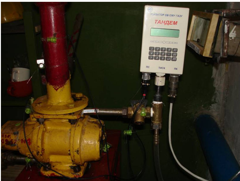
Рис. 3. Газовий лічильник.