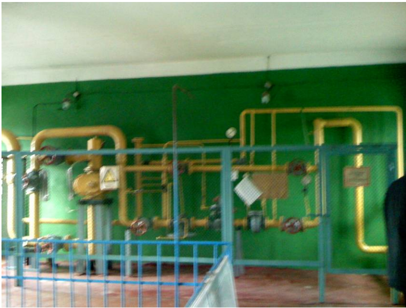
Рис. 2. Газо-розподільчий пункт.

Контроль та моніторинг системи зводиться до вимірювання споживання палива. Інші параметри отримуються розрахунковим шляхом або з статистичних даних. Вимірювання споживання палива відбувається на газо-розподільчому пункті котельні. Реєстрація газу відбувається в одиницях об’єму приведених до стандартних умов за допомогою автоматичних коректорів по температурі і тиску. Типова схема газо-розподільчого пункту наведена на Рис. 2, типовий газовий лічильник показано на Рис.3.